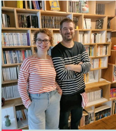
NEW ! Muzette Bistrot à livres Rue Griange, 17