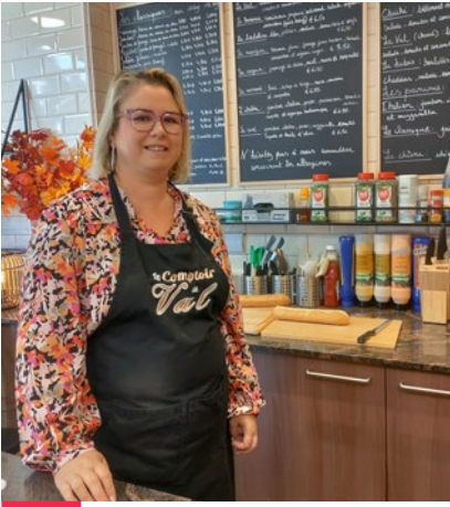
NEW ! Le comptoir de Val Sandwicherie, épicerie Grand-Place, 14