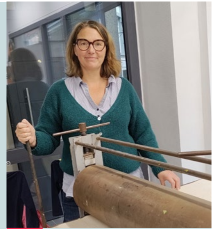
DÉMÉNAGE ! Ruche des Artistes Ateliers créatifs pour tous, expos Rue Griange, 16