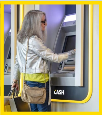
NEW ! Point CASH 3 distributeurs de billets Avenue Albert 1 er , 1