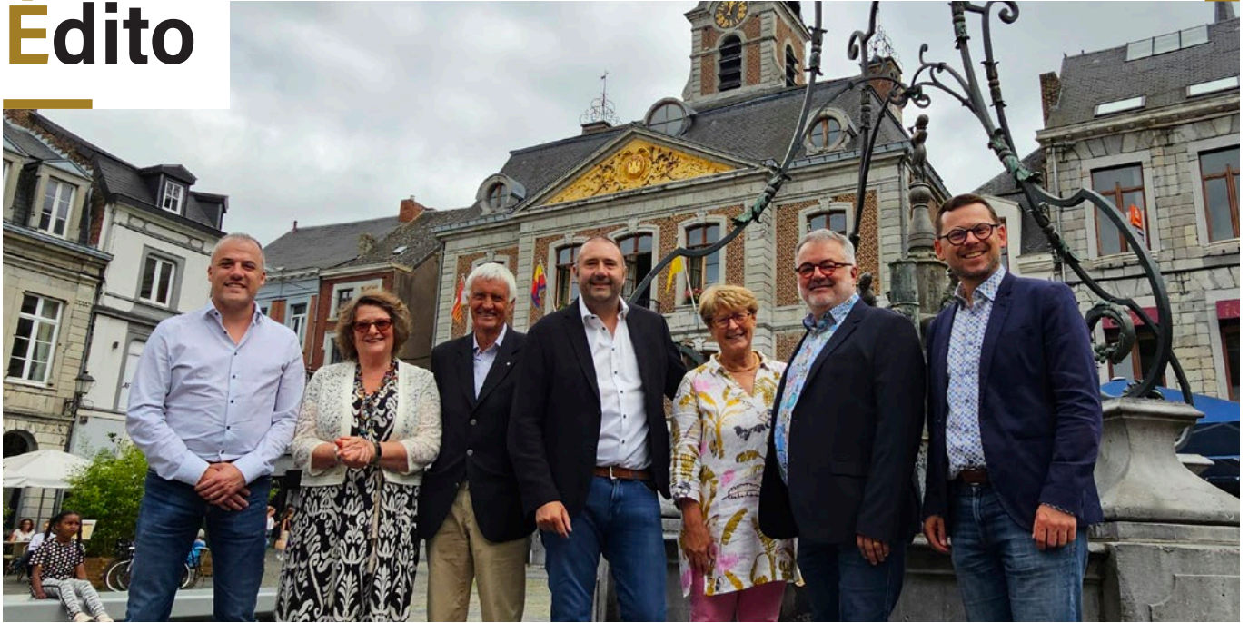
Collège communal 2018 - 2024