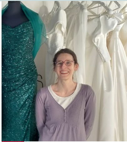
DÉMÉNAGE ! Mariés de Marie Boutique de mariage Rue du Pont, 28