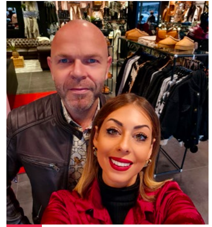
REPRISE ! Eros Huy Prêt-à-porter & acc. pour femmes Avenue du Bosquet 41/16